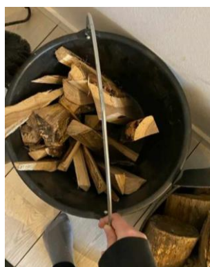
Find en cirkel og mål diameter