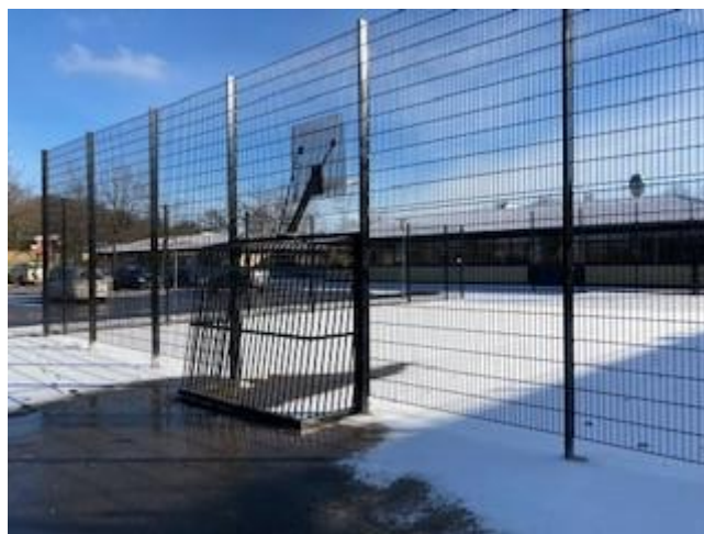
Ny boldbane ved blok B

I dag har 0-5 kl. fejret fastelavn. På skolen har der været klassevis tøndeslagning, snørrebåndsspisekonkurrence, fastelavnsløb og "Fællessang hver for sig" og rundt om hjemme hos 5. kl. har der været kahoot og fastelavnshygge.