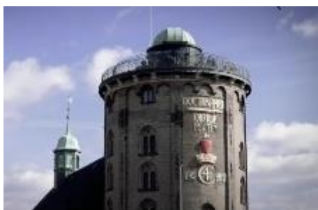
Online ekskursion til Rundetårn