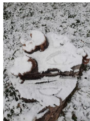
Find spor i sneen

Andre elever har arbejdet med emnet "Vi holder af hverdagen" og har i den forbindelse lavet tekster om skoleelevers hverdag februar 2021, her i uddrag: