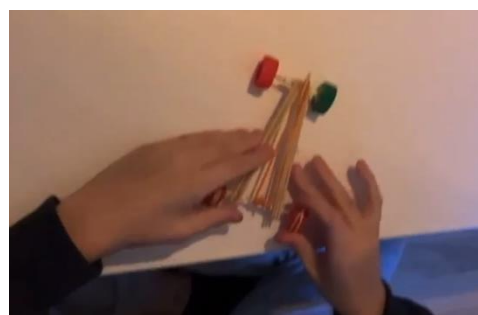
Toys by trash